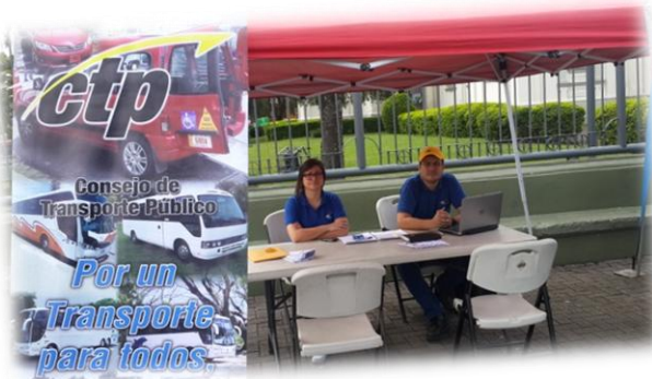
Feria de Servicios Públicos Heredia