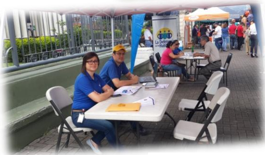
Feria de Servicios Públicos Desamparados