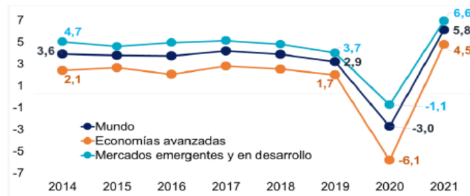
Gráfico 2. Crecimiento de la producción mundial (porcentajes)

Recientemente, el Banco Central de Costa Rica informó, con datos del Fondo Monetario Internacional, que la caída en el Producto Interno Bruto mundial será del 3,0% en el 2020, con una recuperación del 5,8% en el 2021. Esta disminución del producto será más profunda en las economías avanzadas, la cual se estima en -6,1% en el 2020, con una recuperación del 4,5% en el 2021.