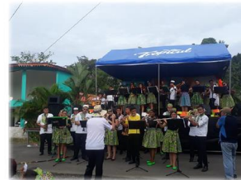
Festival Internacional de Calipso Escuela SINEM CUN-Limón con apoyo de la sede de Siquirres - Agosto 2019

El Sistema Nacional de Educación Musical es un programa social de desarrollo humano, que busca promover el desarrollo integral de niños y jóvenes de todo Costa Rica a través de la enseñanza de la música.