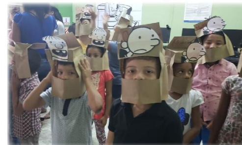
Taller de Lectura Verano 2020 Biblioteca Pública de Limón - Enero 2020