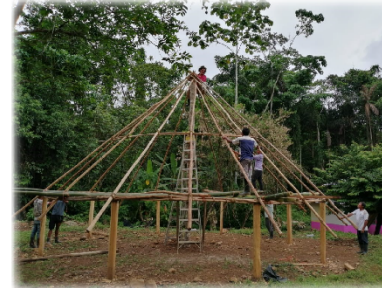
Museo de Cultura Bribri "Recordando lo nuestro": Talleres participativos para construir el Museo de la Cultura Bribri, en la comunidad de Barrio Escalante, quienes rescatan elementos culturales que se han dejado de practicar con el pasar del tiempo. Talamanca, 2019