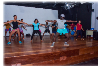
Entre tejiendo nuestro movimiento "Acercamiento histórico a los ritmos de comparsas limonenses": A partir de la memoria colectiva, identificar los elementos principales que permitan recrear y reinventar el sentir de los comparseros de las décadas pasadas. Limón, 2019