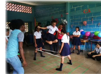
Cantos de cuna y juegos tradicionales en creole: contribuir a la recuperación de la memoria histórica de la provincia de Limón, mediante la recopilación de juegos y cantos infantiles que fueron populares en el pasado. Limón, 2019