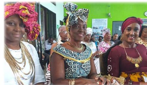
Conversatorio sobre la vestimenta utilizada en el Grand Parade Biblioteca Pública de Limón - Agosto 2019