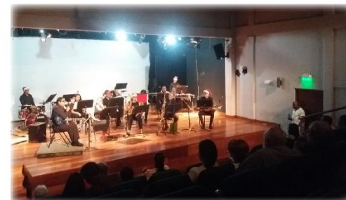
Presentacion Banda de Conciertos de Limón Casa de la Cultura de Limón - Noviembre 2019