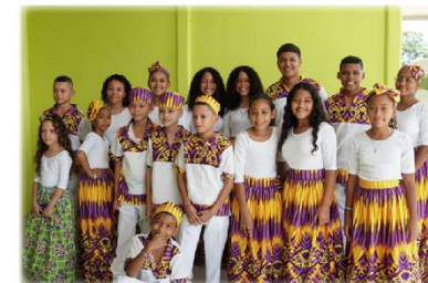
Festival Internacional de Calipso Escuela SINEM CUN-Limón - Agosto 2019