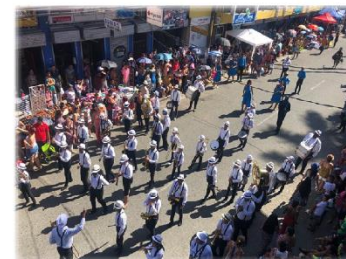
Participación en el Grand Parade Escuela SINEM CUN-Limón - Agosto 2019