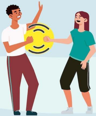
CON EL PUÑO DE LEJOS