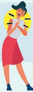
JUNTANDO LAS MANOS