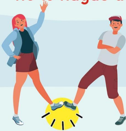
CON EL PIE