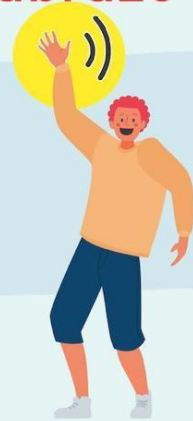
AGITANDO LAS MANOS