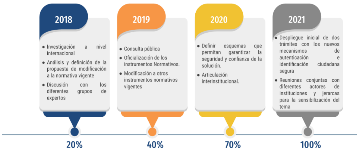
Figura N° 2 Cronograma de actividades y porcentaje de avance esperado